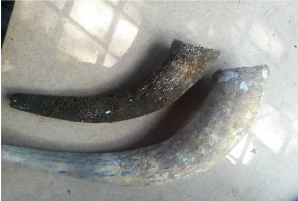
Cuerno sacado de la tierra con el contenido recién extraído