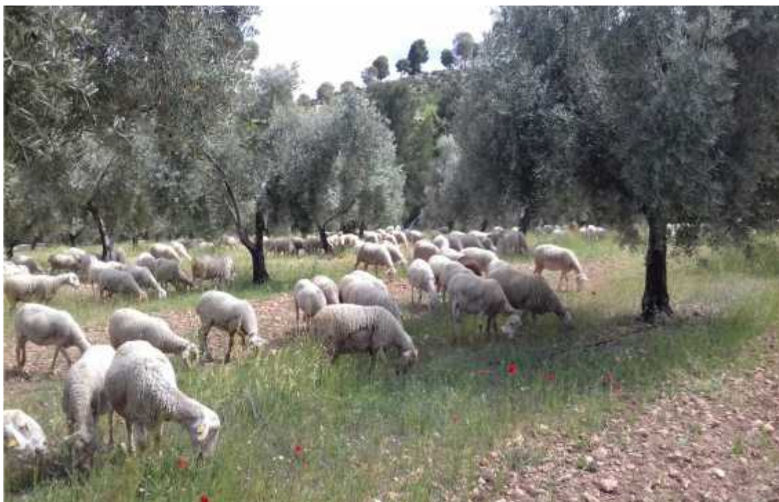
Ovejas de un vecino pastando la cubierta vegetal de nuestras olivas

En el municipio de Yeste Albacete, entre los ríos Taibilla y Segura con una altitud media de 700 metros cultivamos 16 hectáreas de olivar con técnicas de agricultura ecológica biodinámica.