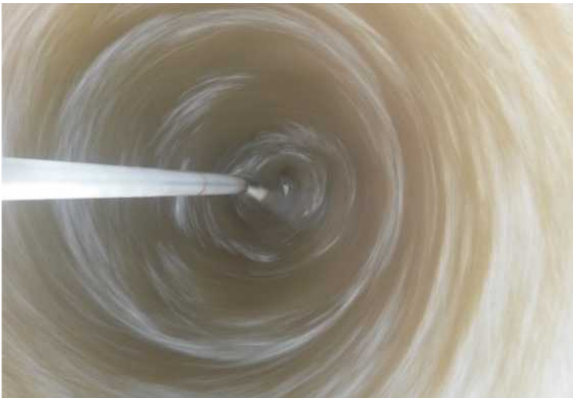
Imagen de nuestro dinamizador mecánico en funcionamiento (momento en el que se forma el vórtice)

Según Steiner, los preparados para rociar, de boñiga en cuerno y de cuarzo en cuerno, afectarán la dinámica del crecimiento de la planta en todo su ciclo. Ambos preparados se remueven enérgicamente en agua tibia de manera que con el movimiento se forme un fuerte remolino. Durante una hora se va cambiando alternativamente el sentido del giro. Remover pequeñas cantidades de material en grandes cantidades de agua se llama dinamizar. Este proceso transfiere las fuerzas y cualidades del preparado al agua. Mucha gente que trabaja con biodinámica encuentra que esto es una forma de actividad meditativa.