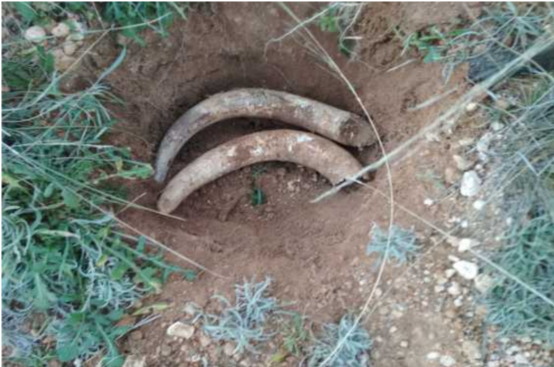
Cuernos de vaca llenos de sílice enterrados en nuestra finca para elaborar preparado 501

Impulsor de los procesos de la fotosíntesis de los cultivos, conservante de los frutos además de preventivo contra enfermedades criptogámicas.