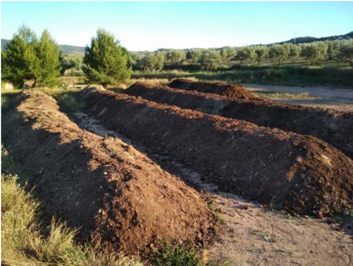
Nuestras pilas de compost