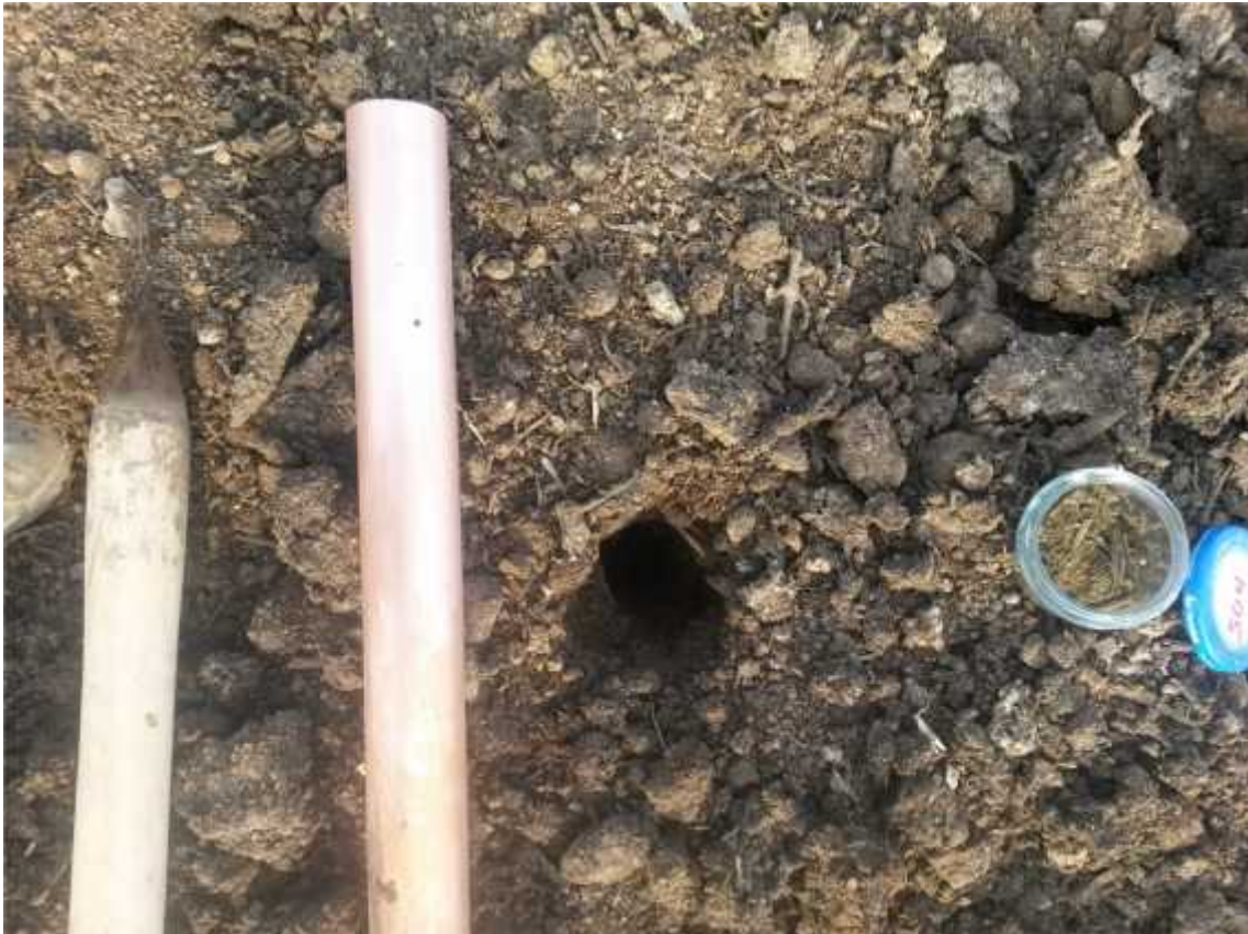
Poniéndole los preparados biodinámicos del compost con la ayuda de un tubo.